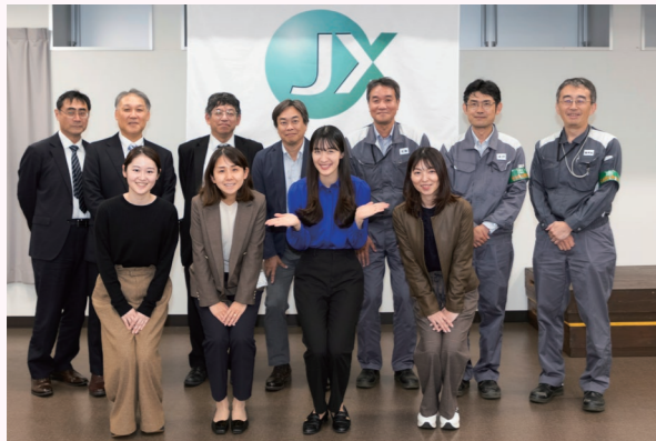
ご案内いただいたJX金属の方々と見学の見学記念写真。