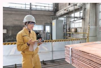
完成した電気銅は、まとめられフォークリフトで運搬される。