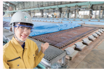
電解工場の電気分解槽。アノードとカソードを交互挿入している。