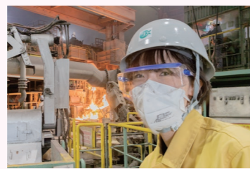
アノード製造。保護メガネにマスク越しでも満面の笑みなのがわかる。