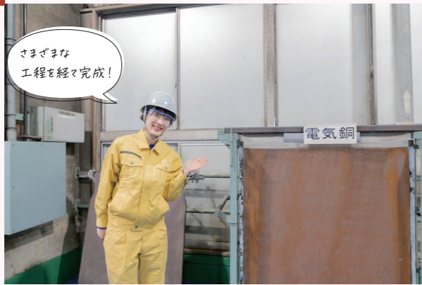
さまざまな工程を経て完成！ 電気銅 サンプルの電気銅の前で。電気銅は電気分解により銅品位99.99%以上に精製されている。