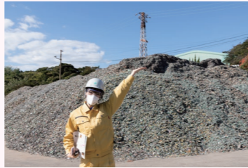
リサイクル原料となる小型家電や配電線など。