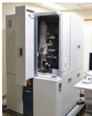
電子プローブマイクロアナライザー (EPMA)