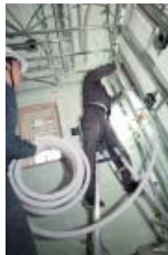
ヘッダー工法の施工