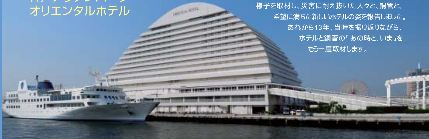
港の埠頭に浮かぶ美しいホテル

平成7年7月7日、777発の花火が神戸港を彩る中、「神戸メリケンパークオリエンタルホテル」は、阪神・淡路大震災と言う未曾有の災害を乗り越え、無事に竣工を迎えました。本誌では当時のホテルの様子を取材し、災害に耐え抜いた人々と、銅管と、希望に満ちた新しいホテルの姿を報告しました。あれから13年、当時を振り返りながら、ホテルと銅管の「あの時と、いま」をもう一度取材します。