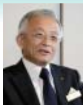
神戸メリケンパーク オリエンタルホテル

震災にあった時、当ホテルはまだ建築中で、これは予定通りの竣工は難しいと思いました。しかし、オーナーから「神戸の人達を元気づけるために、なんとかオープンさせてほしい」と頼まれまして、建築会社もホテルも一丸となって工事再開に挑みました。その時、銅管には本当に助けられました。調査してみると、なんと銅管にはほとんど被害がなかったのです。一から配管し直すことになっていたら、まず7月の竣工は不可能だったと思います。私は長年ホテル業界にいますが、ホテルの配管に銅を使うのは当たり前と考えています。銅管は、殺菌性があるので衛生面も優れていますし、耐久性・施工性などでも評価が高い。お客様をおもてなしするには、目に見えない所にも、最高の品質を用意すべきだ。初期投資を变に抑えても、5年・10年先に障害が出るようでは意味がない...。ですから、あの時も昔から信頼している銅管を迷わず採用しました。その結果が、この答えとなって現われたのでうれしかったですね。銅管は、ねばりがあって地震に強い、そんな言葉を思い出し、なるほどと実感したものです。当時もいまも「ホテルは、ゆとり・快適・安全を、何気なく提供できる場所であるべき」という信念があります。お客様の期待を裏切らない、より良いサービスを目指し、これからもスタッフと銅管に頑張ってもらいます(笑)。