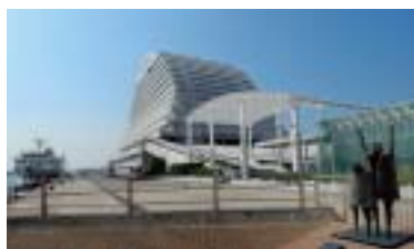
旅客ターミナルとしての機能も備えている