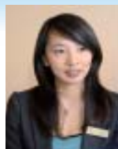
神戸メリケンパーク オリエンタルホテル 広報室