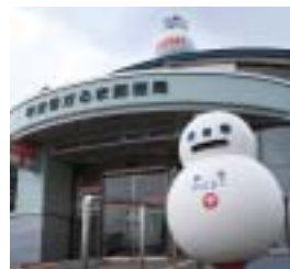
早来雪だるま郵便局