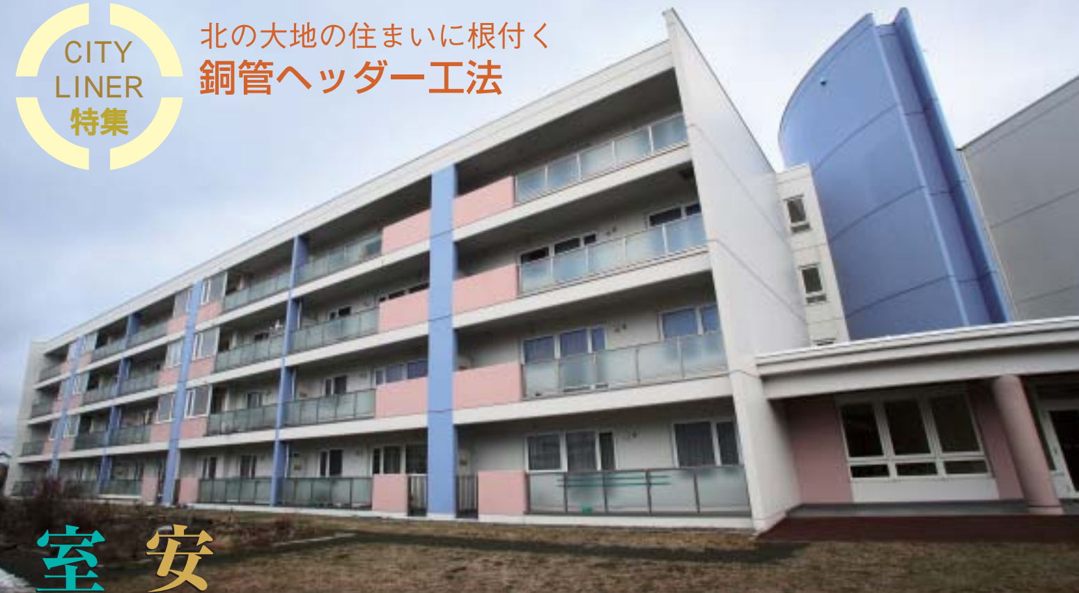
安平町追分南公営住宅

北海道は、給水・給湯配管の銅管使用率が非常に高い場所です。銅管の特性への理解も深く、つねに最新の施工方法などを積極的に取り入れられ、さらに北海道という厳しい気候・風土の中で独自の創意工夫を行われた非常に参考になる事例が多い土地でもあります。そんな北海道の住宅で銅管ヘッダー工法は、どのように活かされているのでしょうか。今回、私たちが訪れたのは、勇払郡安平町と室蘭市。そこで公営住宅、戸建住宅に採用される銅管ヘッダー工法の現場をレポートします。