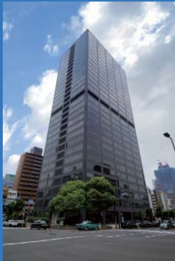
大阪大林ビルディング(竣工:昭和48年)

ろう付けで改修工事を行う場合は、水が出ると作業できなくなりますが、機械式継手はその心配がないのでうれしいですね。この継手なら特別な技術が不要ですから、人的な問題もクリアできます。また、充電式なので、脚立に上って作業する場合も使いやすかったですね。ちょっと気になったのは、重さです。基本的に銅管は軽いのですが、機械式継手は、かしめ部の強度を高めるために、その部分が少し重くなっていますね。それを改善できれば、もっと良いでしょう。でもこれだけ便利なことには本当に驚きました。社内でも評価が高く、今後も改修工事には、機械式継手を使っていこうと評判になっています。