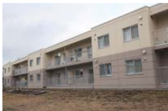
昨年完成した早来大町東公営住宅