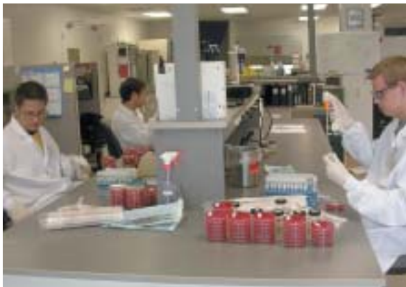
◆ 米国での銅の実験風景