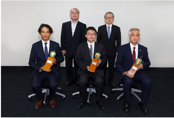
明治神宮銅屋根葺き替え工事の皆さん