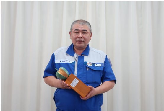
住友電工ウインテック株式会社