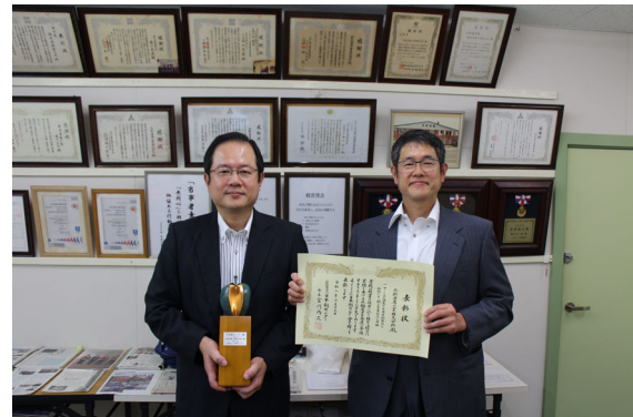
北新金属工業株式会社